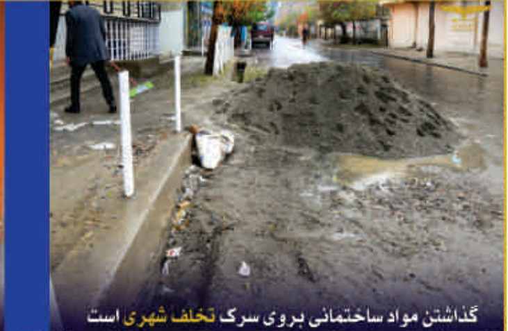
گذاشتن مواد ساختمانی بروی سرک تخلف شهري است