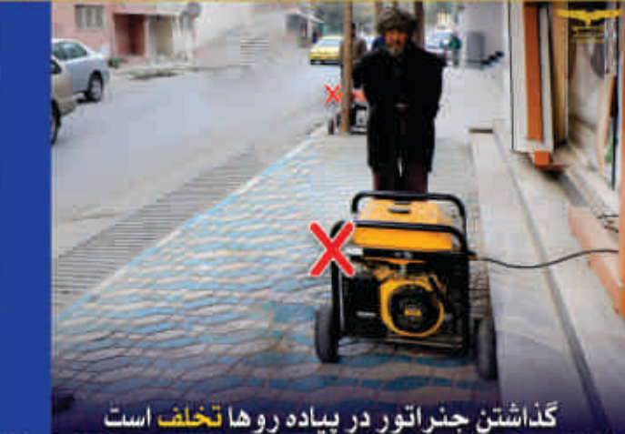
گذاشتن جنراتور در پیاده روها تخلف است