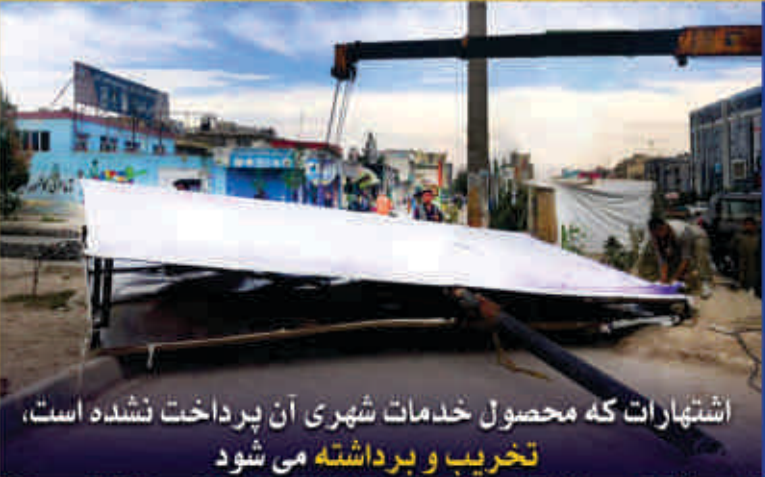
اشتهارات که محصول خدمات شهري آن پرداخت نشده است، تخریب و برداشته می‌شود