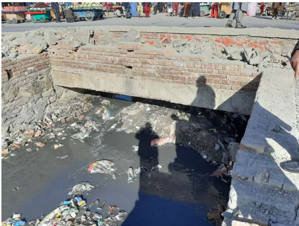
رسم توضیحي 2 کانال باغچه کابل قیل از پاک کاری