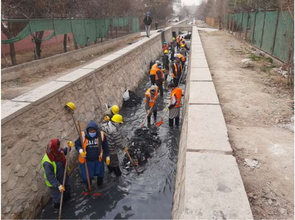
رسم توضیحی 3 جریان پاک کاری کانال از پنج صد فامیل الی لب جر در ناحیه یازدم