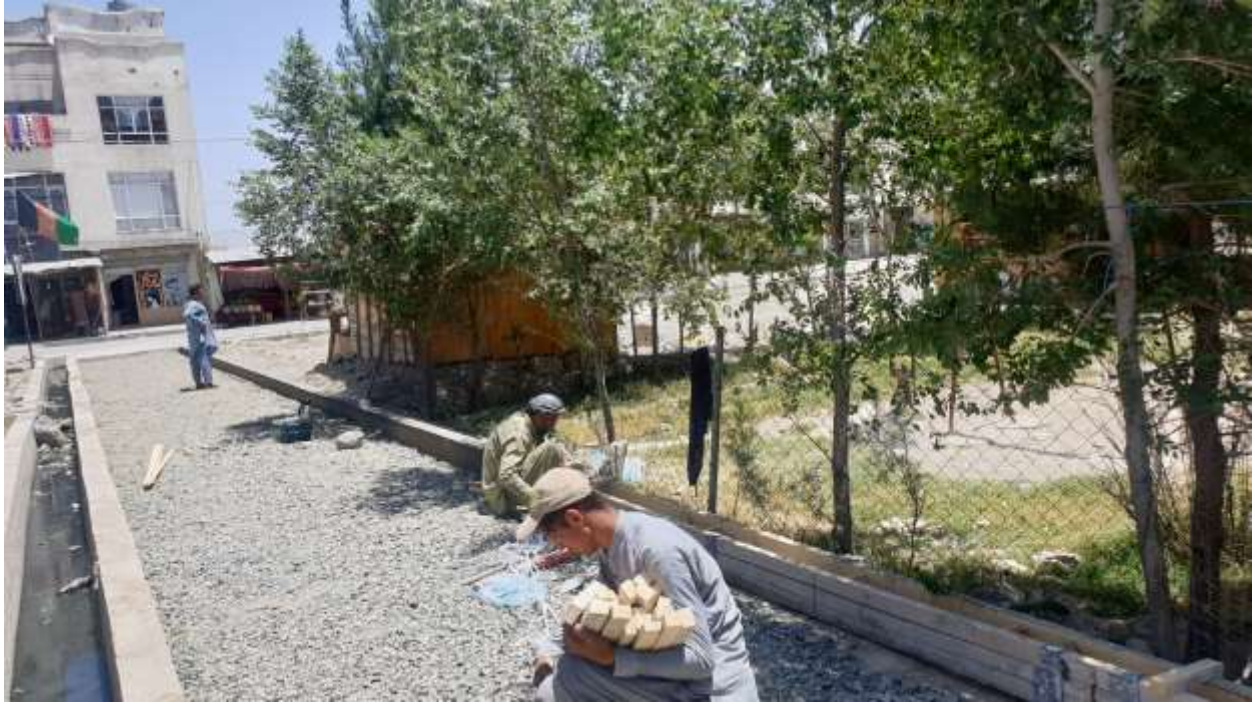
رسم توضیحي 6 جريان کار پياده روی سرک رحمان مينه