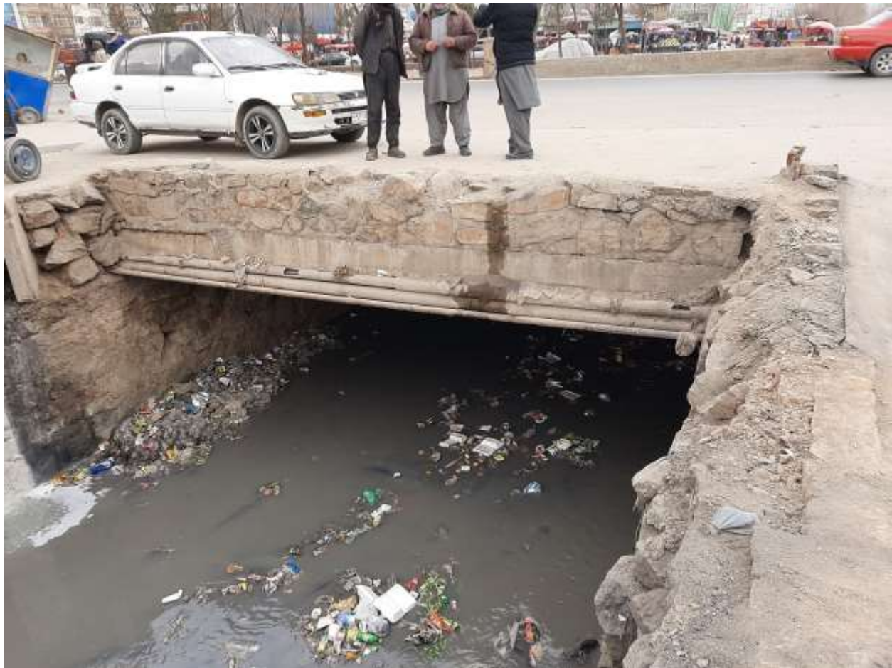
رسم توضیحی 1 کانال باغچه کابل بعد از پاک کاری

پاک کاری کانال باغچه کابل در ناحیه یازدهم شهر کابل تکمیل گردیده است.