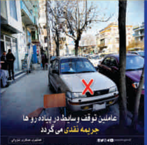
عاملين توقف وسانډ در بيا د زو ها جریمه نقدی می گردد