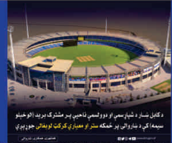
د کابل ښار د ښار سيمې او دوولسمې ناحيې پر مشرک بريد (الو خيلو سيمه) کې د ښاروالي پر ځمکه ستر او معياري کرکټ لوبغالي جوړېږي