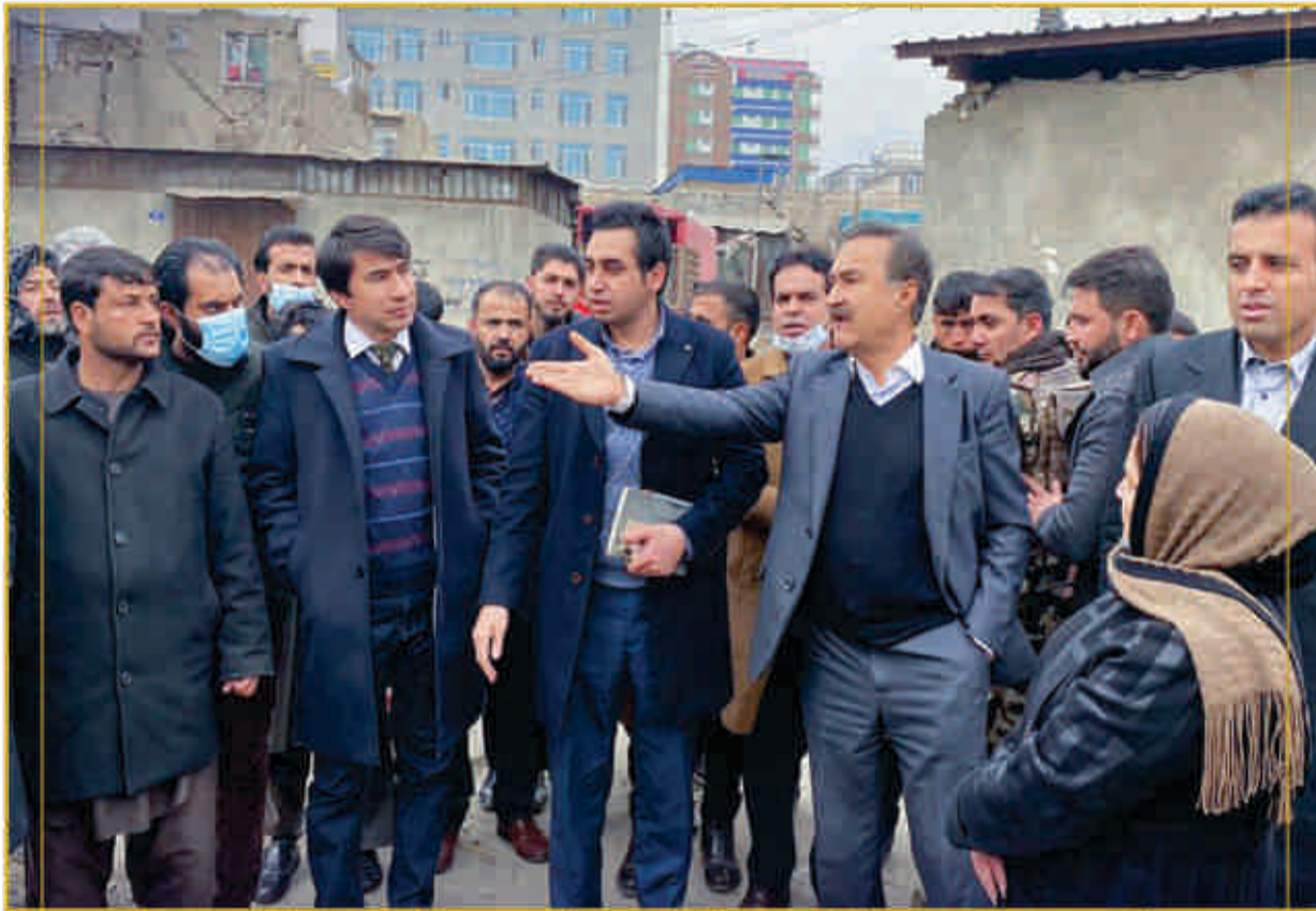
به منظور تحقق نظم شهری و عملی کردن برنامه های زیباسازی، محمد داود سلطان زوی شاروال کابل از نقاط مختلف ناحیه اول بازدید نمود. شاروال کابل ضمن ارزیابی بازارها، در مورد ایجاد و گسترش ساحات سبز در نقاط مختلف