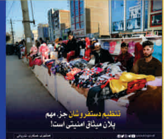
تخليم دستفروشان جز ميم پلان ميثاق امنيتی است!