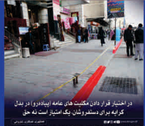
در اختيار قرار دادن مکملت های عامه (بياددرو) در بدل کرايه بر اي دستفروشان یک امتياز است نه حق