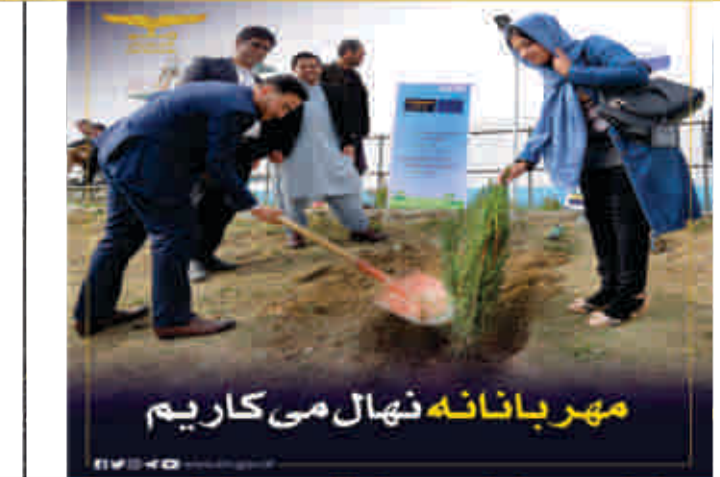
مهربانانه نهال می کاریم