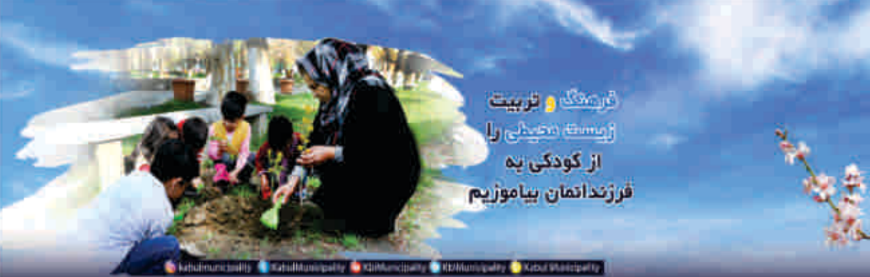
تربیت و فرهنگ زیادتی و خدایت از کودکی به فرزندانتان بیاموزیم

کابل شهروالی د بنسټیو کولو او تله پاتي پراختیا لیدلوري پر بنسټ خلکو ته د خدمتونو وړاندې کولو په برخه کې اقدام وکوي. د باغ بالا په سیمه کې په ۲۱۲ جریبه ځمکه کې انټر کانتیننټال هوټل، موزیم، باغ بالا هوټل او جومات، د (پیرلند) مقبره او زرغونې سیمې موقعیت لري. دا باغ دغه راز د کابل بنسټیو لویه تفریحی سیمه هم بلل کیږي، چې د پسرلي او اوږي په موسمونو کې هره ورځ ورته زیات خلک د تفریح لپاره ورځي او د دې باغ له پاکې او