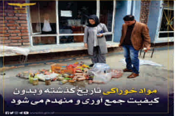
مواد خوراکی تاریخ گذشته و بدون کیفیت جمع آوری و منهدم می شود

د ښار په پاکي او چاپیریال ساتنه کې د ښاریانو د گلډون په موخه د لسمې ناحیه په لړوند سیمو کې تنظیفی حشر تر سره شو. په یاد حشر کې د ناحیې مسوولانو، ښځو، ځوانانو او د خصوصي تنظیفی شرکتونو استازو ګډون کړی وو او ټینګار یې وکړ چې اړینه ده ټول ښاریان د ښار په پاکي، چاپیریال ساتنه او زرغونتیا کې مرسته وکړي، ځکه پاک او صفا ښار د خلکو په مسئولیت منلو او هیودانی مینې پورې اړه لري. د یاد حشر په پایله کې یو شمیر تیت کثافات راټول او له ښاره د باندې ټاکل شويو ځایونو ته ولیردول شول او دغه راز هغه د اوبو لیستي چې د کثافاتو له امله بند وو هم پاک شول.