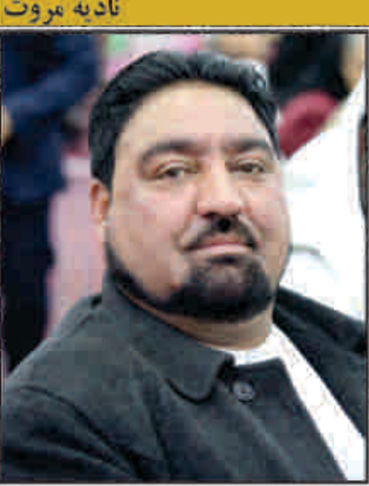
شاروالی کابل به همکاری بانک جهانی سمند گردیده است.

کوچه باغ قاضی و بسیاری از کوچه های دیگر، توسط موسسه آغا خان سنگ فرش گردیده است. سلیبرها و آبروهای کوه ها از سوی شاروالی کابل به همکاری اداره هیئات، ساخته شده است.