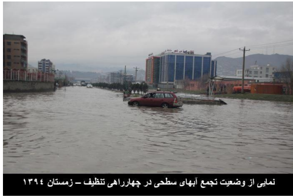
نمایی از وضعیت تجمع آبهای سطحی در چهارراهی تنظیف - زمستان ۱۳۹۴