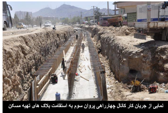
نمایی از جریان کار کانال چهارراهی پروان سوم به استقامت بلاک های تهیه مسکن