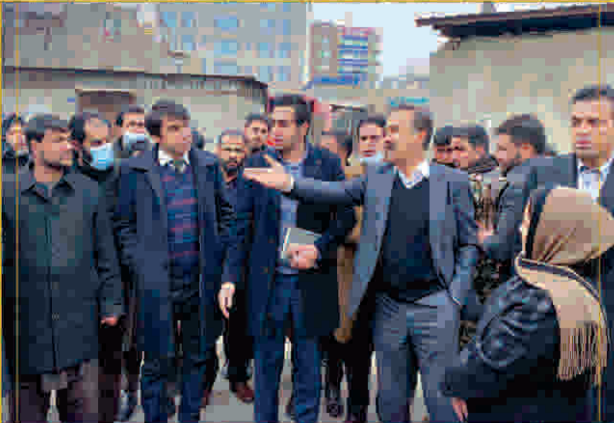
به منظور تحقق نظم شهری و عملی کردن برنامه های زیبا سازی، محمد داود سلطانزوی ښاروال کابل از نقاط مختلف ناحیه اول بازدید نمود. ښاروال کابل ضمن ارزیابی بازارها، در مورد ایجاد و گسترش ساحات سبز در نقاط مختلف