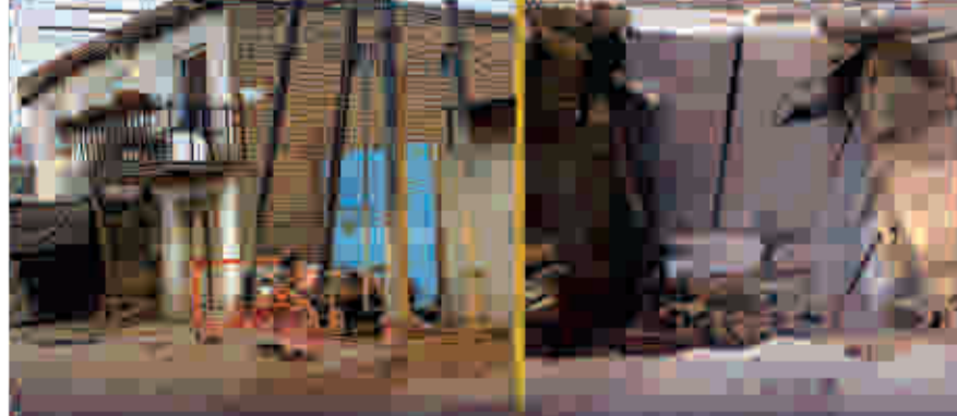
حضر هر نوع چاه در شبکات ییاده روی ممنوع است

کابل ښاروال محمد داود سلطانتزوی د کابل ښاروالی - تهران او نورو لویو ښارونو ترمنځ د ګډو همکاریو او د کابل او تهران ترمنځ د دوه اړخیزو همکاریو د غښتلتیا په موخه د ایران له سفیر ښاغلي بهادر امینیان سره ولیدل. کابل ښاروال لومړی د ایران له سفیر سره د کابل ښاروالی نوي پلاتونه او پروګرامونه او دغه راز د کابل ښار لرلید شریک کړ او په پلي کیدو کې