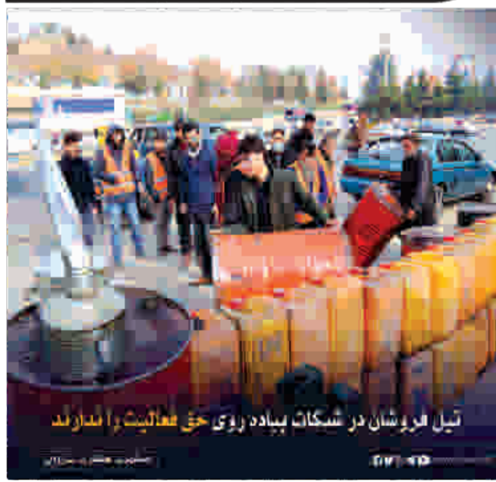
تیل لوروشان در شیکات ببادد روی حق فعالیت را اندازند

د هری شاروالی کابل که لامهای اساسی را برای ایجاد شير اکتشاف یافته و توسعه متوازن و پایدار بر داشته و با قابلیت جركسانی کند از شير و داندان می نطلبند تا با ناند شير و داندان سایر شير های پیشرفته دنیا به انجام وظایف و مسوولیت های شير و دندی خویش توجه بیشتر مبذول داشته تا با فکر و کار شير کنه، از مرایای زنده گی شيرت بهره کالی ببرید.