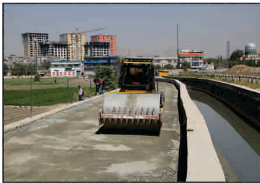
مشکلات تدار کاتی در تهیه و اكمال مواد ساختمانی مورد ضرورت پروژه های این ریاست می باشد.

سرک های اسفالتی، کانکرتی، خامه، سنگفرش، فرعی و سرک های مسدود شده در سال مالی ۱۳۹۹ صورت گرفت است. همچنان اعمار پیاده رو سه راهی دارالامان به استقامت ده دانا، اعمار ۱۵۰۰ متر مربع پیاده رو و ۱۰۰ متر جوپچه در سرای غزنی، ترمیم کانال داخل مدیریت ترافیک کابل، باز سازی فضای سبز چهار راه صحت عامه و چهار راه زنبق، چهار راه دهمزنگ، چهار راه بتخاک، چهار راه ماموریت، چهار راه سرک ۵ تایمنی، خط اندازی سرک های مختلف شهر کابل، جفل اندازی در نواحی مختلف به طول (۸۴۲۰) متر، ترمیم ۶۰۱ پایه چراغ جاده ها، تخریب و انتقال خاک سینما پارک، اعمار ۱۸۰ متر مربع سنگفرش ساحه سبز ایستگاه پوهتون و برداشتن پل هوایی پیش روی شاروالی کابل صورت گرفته است. بر علاوه،