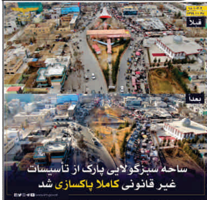
ساحه سبز گولایی پارک از تأسیسات غیر قانونی کاملاً پاکسازی شد