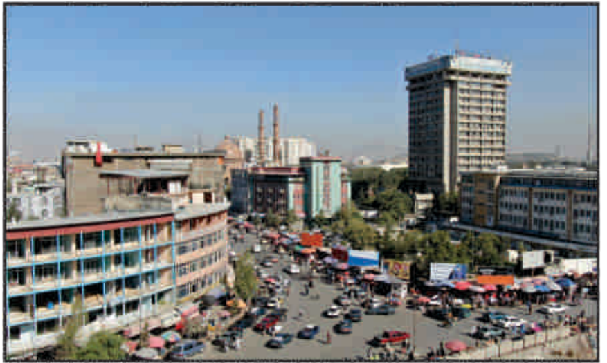
په بنار کې بناري ستونزي څه ډول رامنځته شوي؟

کابل بنار له ډيرې مودې راهيسې د راز راز ستونزو په منگول کې پريوتی، چې ددغو ستونزو له منځه وړل، دومره ساده او آسانه نه بنکاري، خو کابل بناروالی تل هڅه کړې ترڅو له بنار څخه شته ستونزي لږې او بناريانو ته آسانتيا وې رامنځته کړي چې تر ډيره بريده په دې برخه کې بسريالی، ښوي هم ده. په بنار کې د نښو ستونزو رامنځته کيدل بيلابيل عوامل لري او هغه په لاندې ډول دي: 1- ډير شمير هيوادوال چې د ځينو عواملو له کبله، نورو هيوادونو ته کډه شوي وو، يوه برخه يې بيرته هيواد ته راستانه چې ډيري يې دکابل په وړو کې بنار کې ميشت شول. همدا راز د هيواد له نورو ولايتونو څخه ډير لږ ستونزو له امله هم ډير شمير خلک له خپلو کورنيو سره کابل بنار ته راکډه شول، چې د وخت په تيريدو سره دغو کابوالو په بنار کې د کار د نشووالي له امله او خپلو کورنيو ته د ډوډۍ د پيدا کولو په موخه، پرته له دې چې بناري فرهنگ او مقررات په پام کې ونيسی په يو لږ غير قانوني او خپل سړو کارونو بوخت شول. که څه هم چې د ډوډۍ پيدا کول خلکو ته يوه اړتيا ده خو هڅه دې وشي ترڅو دولت او نور خلک ترينه په تنگ