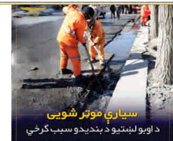
سيارې موټر شويي د اوبو لښتنيو د بنديدو سبب گرځي