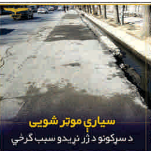
سيارې موټر شويي د سرکونو د ژر نړيدو سبب گرځي

کابل ښاروالی څه موده وړاندې د اروپايي ټولني په مالي ملاتړ د ښار په کچه په ښوونځيو کې د ښاري فرهنگ دودونې په اړه د عامه پوهاوي کمپاین پیل کړی دی چې دا لړۍ لاهم روانه ده. په همدې لړ کې د کابل ښاروالی له لوري د ښاري اصولو په اړوند چاپ شوي ۲۰۰ کتابونه هم د منوچهرې ښځینه لیسې په زده کوونکو ویشل شول. زده کوونکي کولای شي د خپلو کورنیو په مرسته ښاري اصول له دې کتاب زده کړي او وروسته د یوې غونډې په ترڅ کې غوره زده کوونکو ته ډالی ورکول کيږي.