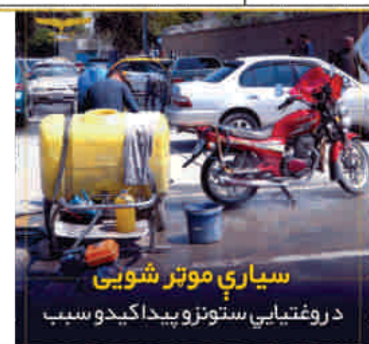
سيارې موټر شويي د روغتيايي ستونزو پيدا کيدو سبب