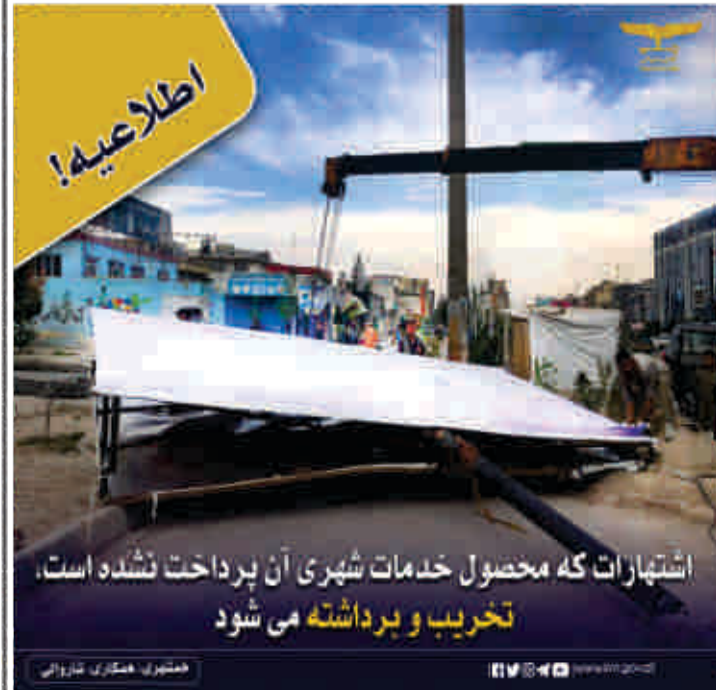
اشتبهات که محصول خدمات شهری آن پرداخت نشده است، تخریب و برداشته می شود