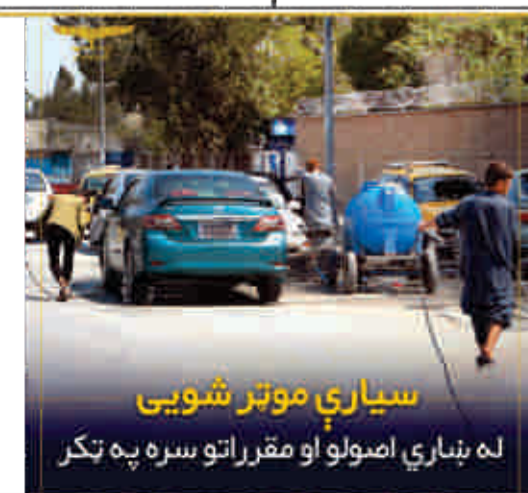
سيارې موټر شويي له ښاري اصولو او مقرراتو سره په ټکر