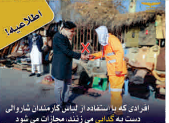
افرادى که با استفاده از لباس کارمندان شاره والی دست به گدایی می زنند، مجازات می شود

شب گذشته طی بررسی مسولان ناحیه سوم شاره والی کابل، مالکان شماری از هتل ها، رستورانها و اصناف مختلف که پیاده روها را مسدود کرده بودند، جریمه و فعالیت سرک ها و پیاده روها، سبب بندش