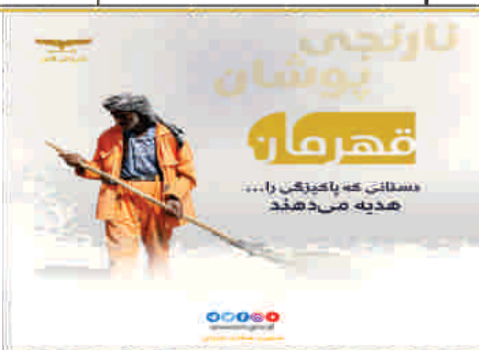
نارنجی پوشان قهرمانان... هدیه می‌دهند