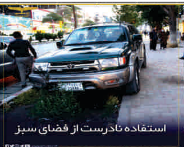
استفاده نادرست از فضای سبز

د یولسمې ناحیې اړوند د خیرخانې مینې د لومړې برخې سرک جوړولو چارې، چې څه موده مخکې پیل شوې وې لاهم روان کال تر پایه به بشپړې شي.