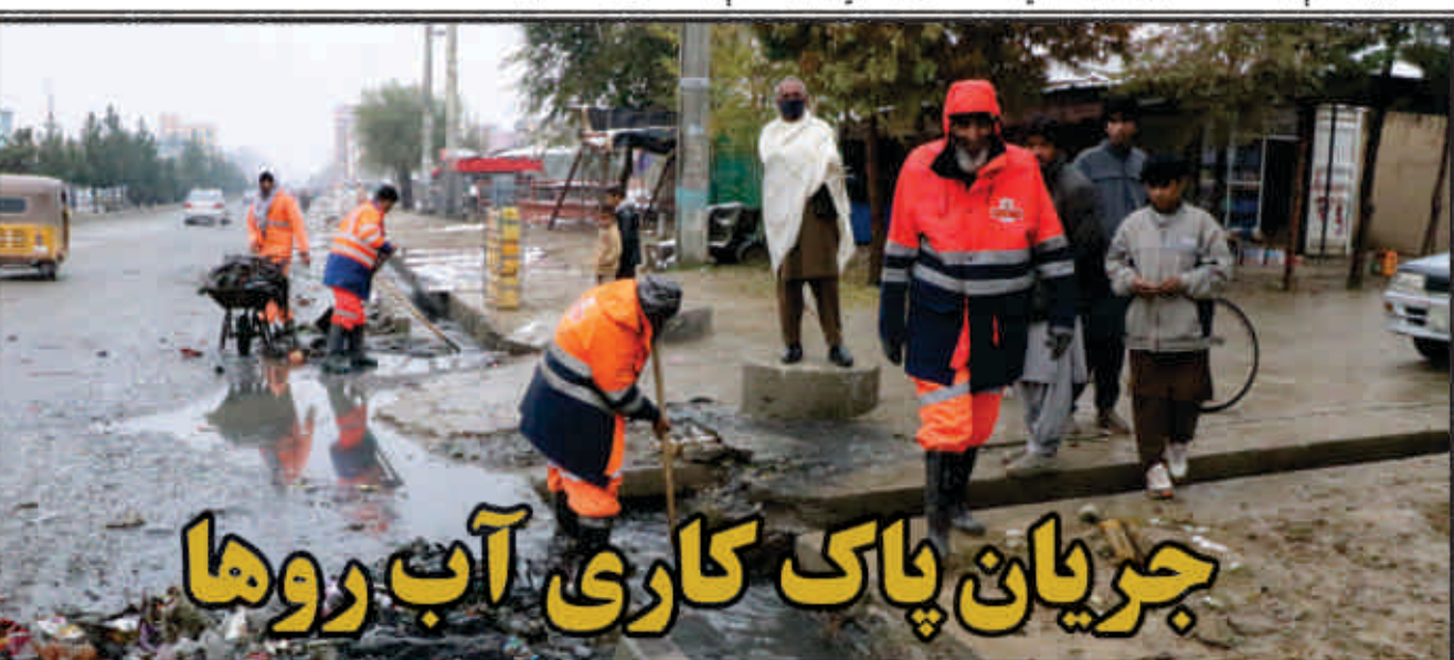
جریان پاک کاری آب روها

پروژې د بیارغونې کار، چې د سپر کونو او کوخو رغول پکې شامل دي د کابل بناروالی له پرمختیایي پروگرام څخه ترسره کیږي. په دغه پروژه کې د ۷.۶۱۵ مترو په اوږدوالي د سپر کونو اساسي رغونه بشپړه شوې چې ژر به کتې اخیستې ته وړاندې شي. کابل بناروالی پخو او اساسي سپر کونه ته د لاس رسې په برخه کې د خلکو مرسته اړینه بولي، ځکه د پروژو اصلي خاوندان بناریان دي او د کیفیت او کمیت له اړخه باید دوی له پسرلو وڅخه څارنه وکړي.