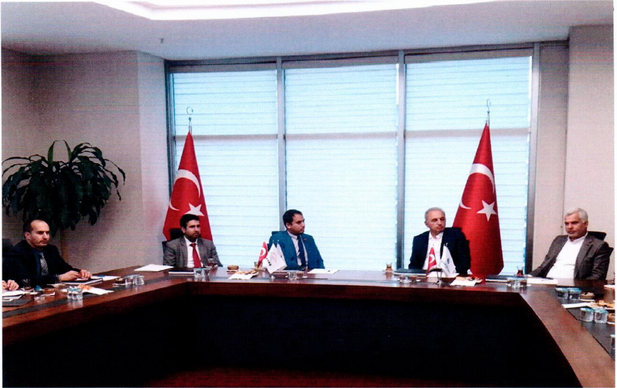
جریان ملاقات هیات شاروالی کابل با رئیس شرکت های ستاچ STACH یک از شرکت های خصوصی شاروالی شهر استانبول