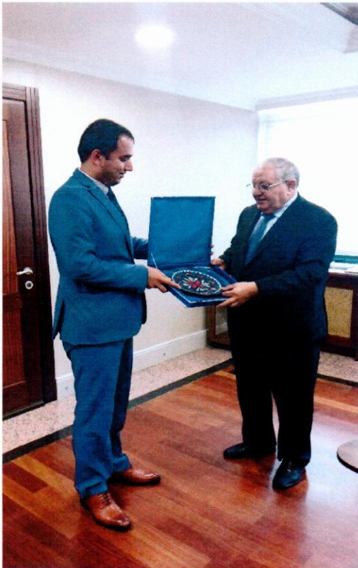
ملاقات با آقای احمد سلامت معاون اول شورای شهر استانبول