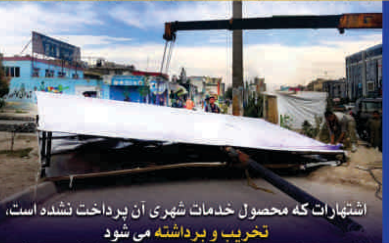
اشتهارات که محصول خدمات شهری آن پرداخت نشده است، تخریب و برداشته می‌شود