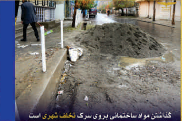
گذاشتن مواد ساختمانی بروی سرک تخلف شهری است