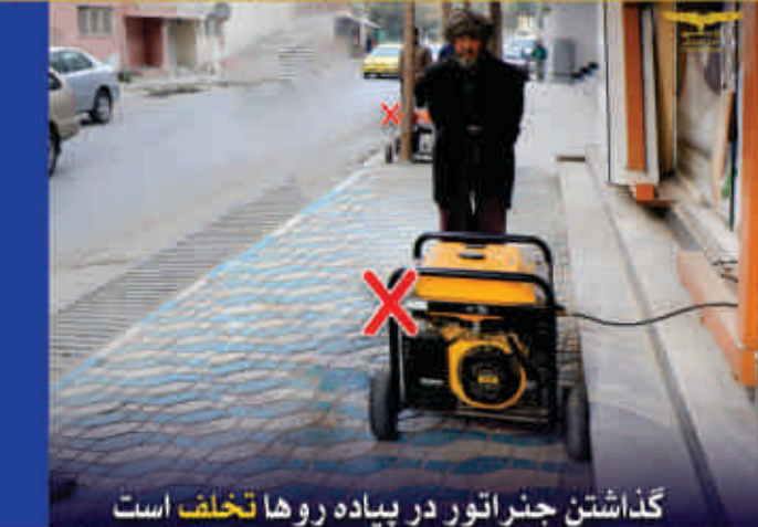
گذاشتن جنراتور در پیاده روها تخلف است