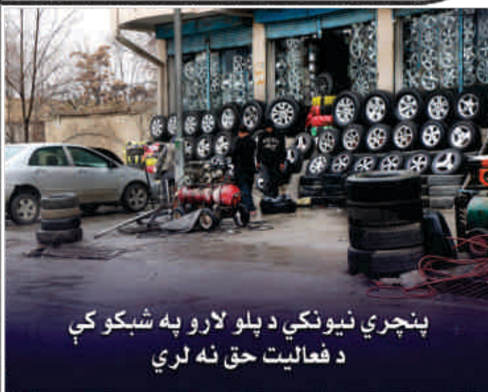
پنچري نیونکي د پلو لارو په شبکو کې د فعالیت حق نه لري